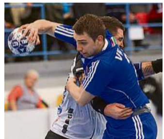
Nem ment az újjáirosiaknak (kékben)

JÉGKORONG. A negyedik mérkőzéshez érkezik hétfőn a Debreceni Hoki Klub-MAC Budapest MOL Liga elődöntő. Az egyik fél négy győzelméig tartó párvialad állása 3-0 a fővárosiak javára, így a cívisek csakis akkor tudják életben tartani a reményt a folytatásra, ha hétfőn győznek. /9. HBN