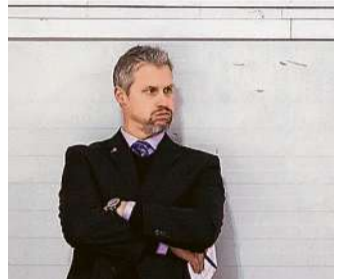
Jason Morgannek ki kell találnia valamit