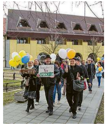
Figyelemfelhívó céllal gyalogoltak