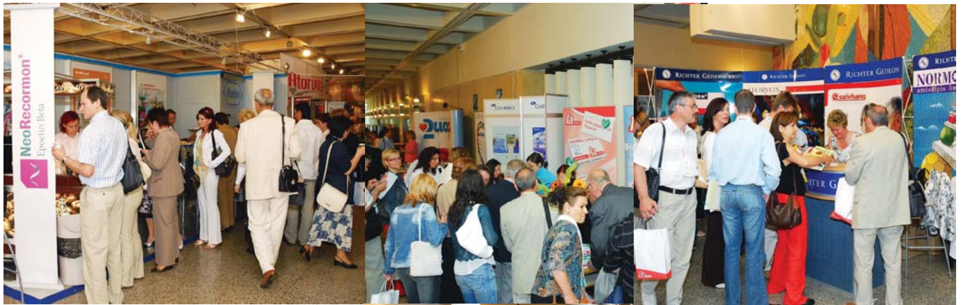
Nagy érdeklődés a kiállítók standjainál