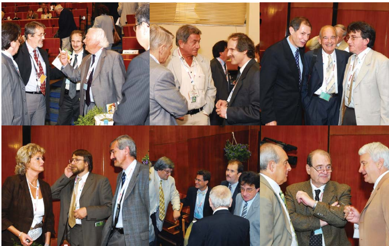
A kongresszus élete. Szakmai munka közbeni szünet, egy kis kikapcsolódás, kötetlen beszélgetések