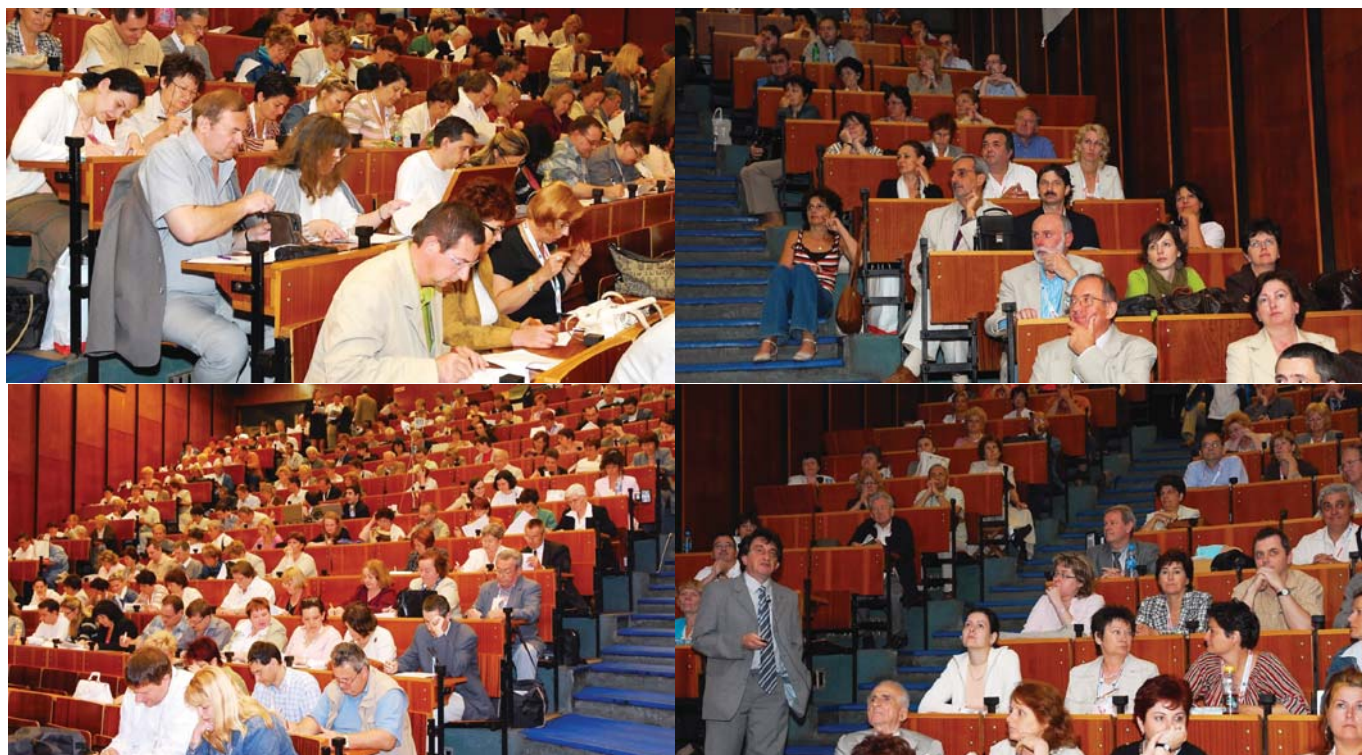
Teszírás, zárszó, teltház!