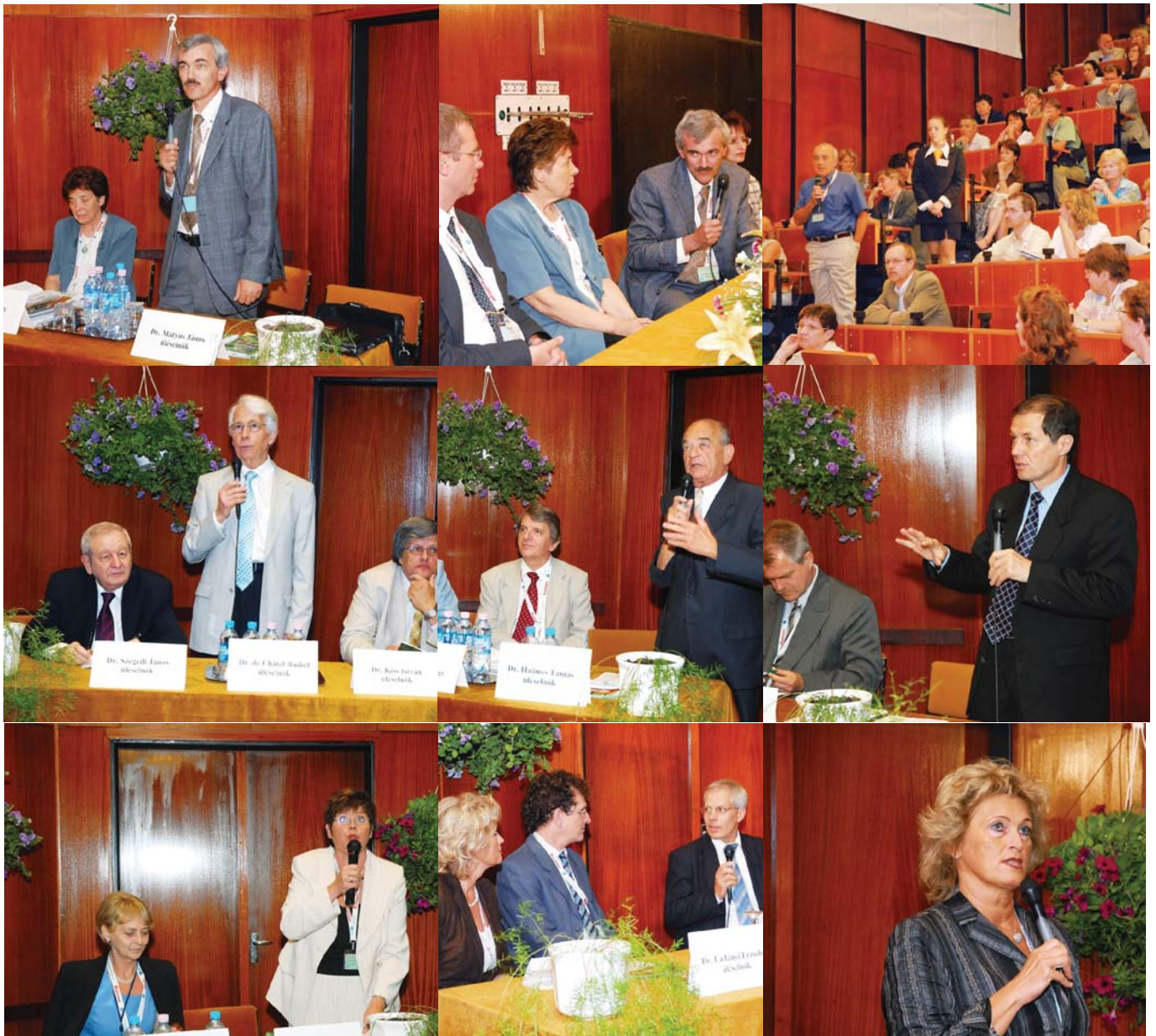
Szakmai munka, előadások, hozzászólások