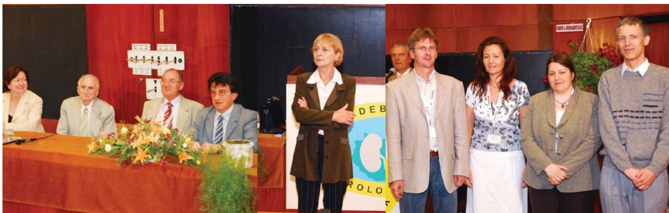
A szakmai verseny, és a győztesek

A DNN szervezői minden évben gondoskodnak arról, hogy az igen gazdag, feszített tudományos programot követően a hallgatóságnak legyen módja a kikapcsolódásra és az ismerkedésre. Nem volt ez másképpen az idén sem. Az első napon egy „rendhagyó” magyaros esten vehettünk részt, igazi magyaros ételekkel, ízekkel, zenével és tánccal. Az időjárás ugyan megrtérált minket és a szabadtérinek indult program az eső miatt végül csak szabad levegős lett a Vig-Kend major fedett teraszán, a rendezők és a nephrologus társadalom gyors helyzetfelismerő és alkalmazkodó képesség-