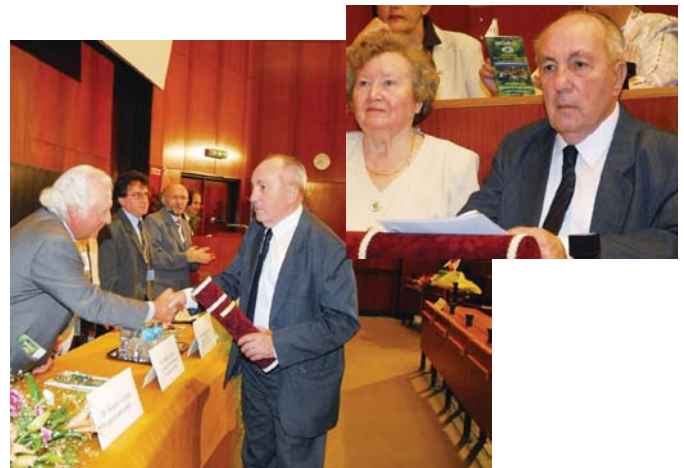
Gál György professzor átveszi a "Magyar Nephrologiáért Életműdíjat". A megatott kitüntetett feleségével

A program első blokkja a „Fény és árnyék a mai orvostudományban” címet viselte. E szimpózium a rendezők azon törekvését példázza, hogy a napi rohanásban egy pillanatra megállva a szélesebb összefüggésekre is felfigyeljünk, felfedezzük a napi gyakorlat kérdései mögött a közös alapelveket, mozgatórugókat. Az előadások a címhez méltóan érdekesek és gondolatébresztők voltak. Gál György professzor „A