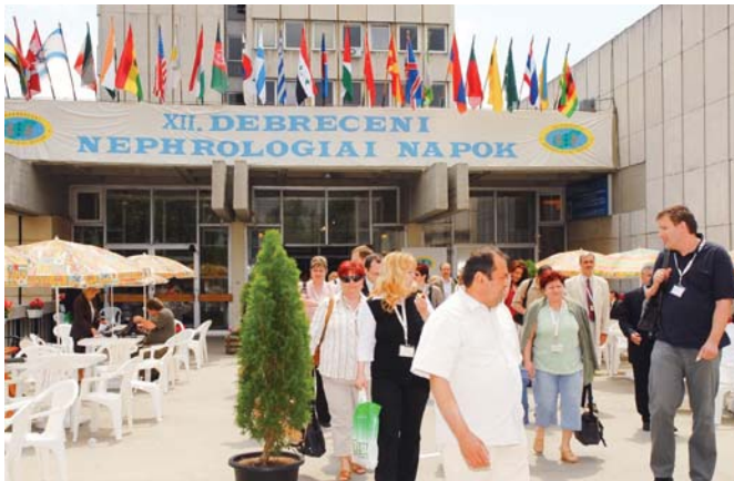
A kongresszus helyszíne