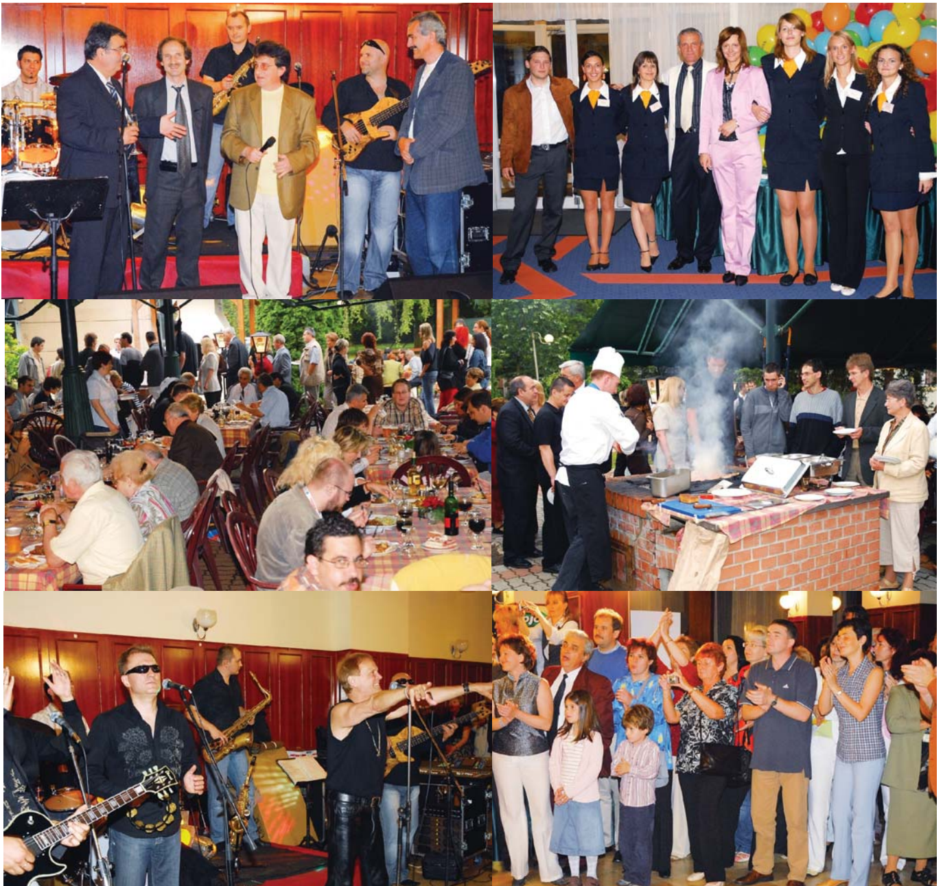
Grill parti és D Nagy Lajos koncert

Szombati nap témái a peritonealis dialízis majd pedig a vesetranszplantáció voltak. Ugyancsak szombaton került sor a hagyományos országos nephrologiai szakmai versenyre, melynek célja amellettt hogy komoly díjakkal tanulásra ösztökélje a résztvevőket, a szakmai megbecsülés biztosítása. Ezért álljon itt az idei nyertesek névsora (azonos teljesítmény miatt két első helyezettet hirdettek ki):